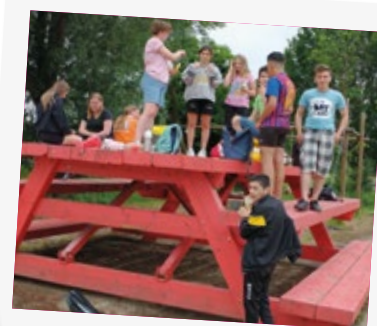
Integreren doe je samen